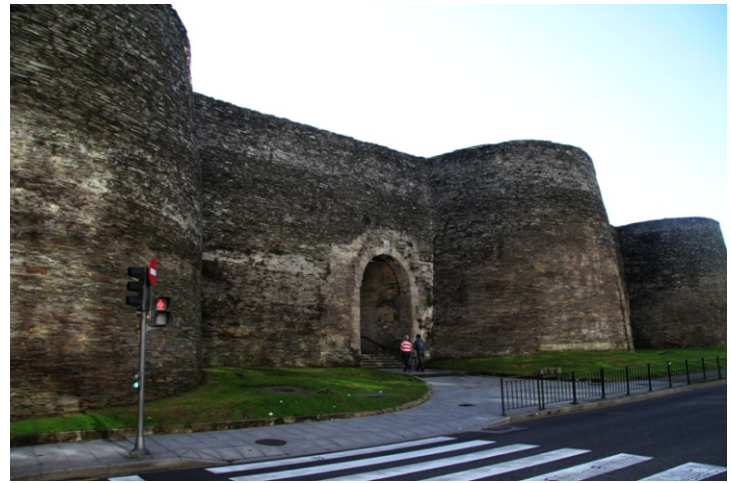
Porta Falsa. Era unha porta de escape en caso de asedio.