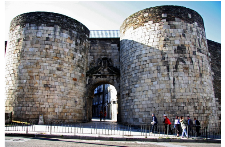
Porta de San Pedro. Por esta porta entraban as calzadas XIX e XX procedentes de Astorga e Braga. Na actualidade é por onde entra o Camiño de Santiago na súa variante do Camiño Primitivo. Está decorada na súa parte exterior co escudo da cidade. Sobre a coroa do escudo da cidade a xente adoita lanzar moedas para pedir un desexo, que se cumpre se a moeda queda enriba.