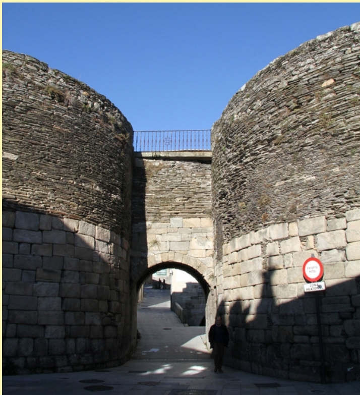
Porta Miñá ou Porta do Carne, a máis antiga, de orixe romana e a que sufriu menos modificacións. Era a porta que daba saída á estrada que ía ao Miño e a Iria Flavia.

Ademais de camiñar e coñecer a muralla podemos aproveitar para visitar o importante patrimonio representativo dos dous mil anos de existencia de cidade: Casa dos Mosaicos, Termas Romanas, Centro de Interpretación da Muralla, Centro Arqueolóxico de San Roque e completalo coa visita á catedral e o burgo vello e aos diferentes museos.