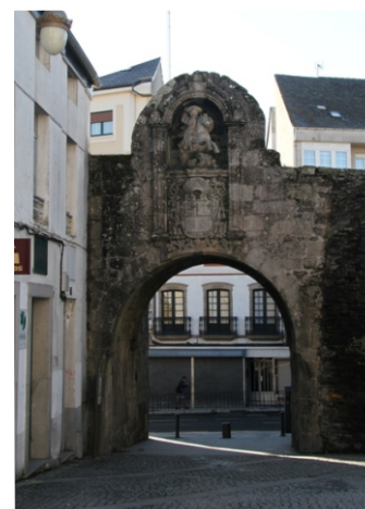
Porta de Santiago ou do Pexigo. É a máis achegada á catedral. Foi unha porta particular dos cóengos para acceder ás súas hortas ata ata 1589. Era unha porta de saída e foi decorada na parte superior cunha imaxe do Apóstolo Santiago.